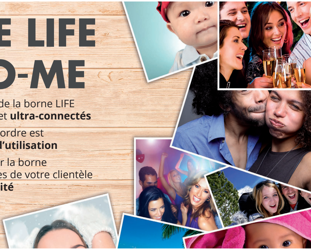
Photo-Me propose aux photographes une nouvelle borne de prise d'ordre simple, conviviale et ultra-moderne. Cette borne répond clairement aux nouveaux modes de consommation de la photo en boutique.